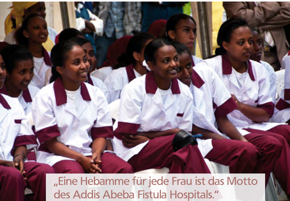
Foto: Jahrgangsklasse des Hamlin Midwifery College

„Eine Hebamme für jede Frau ist das Motto des Addis Abeba Fistula Hospitals.“