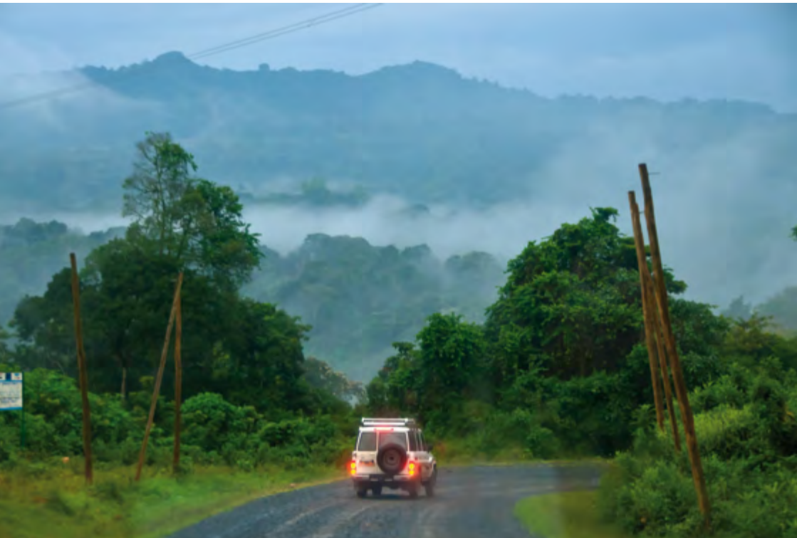
Foto: Straße nach Metu