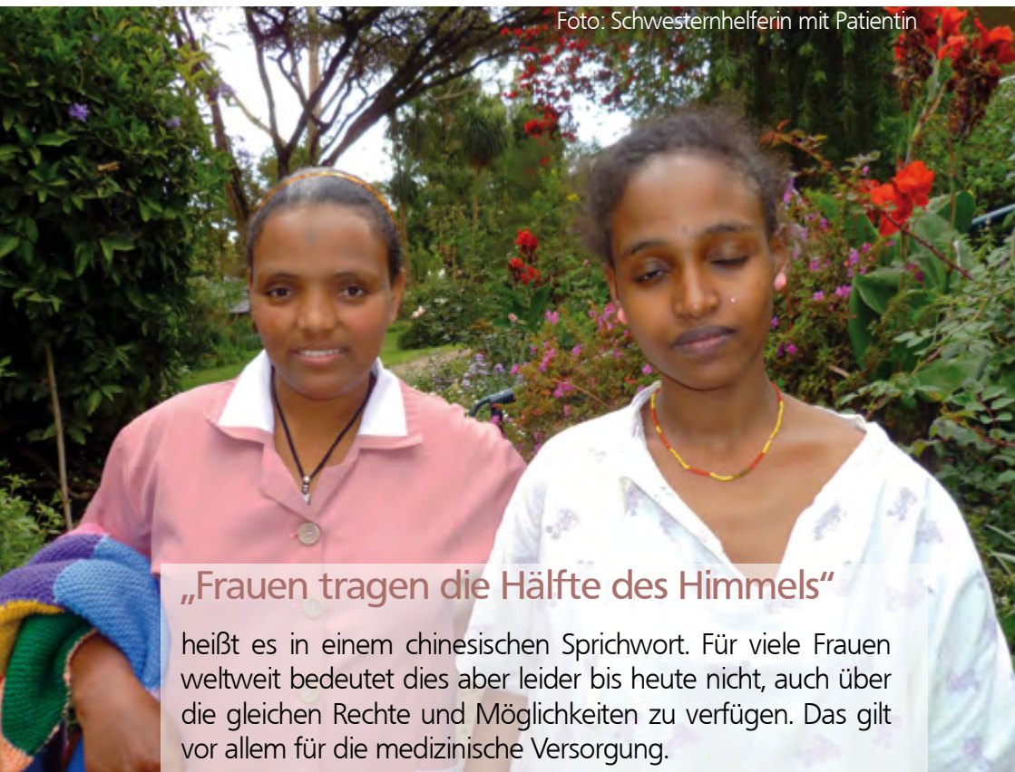
Foto: Schwesternhelferin mit Patientin