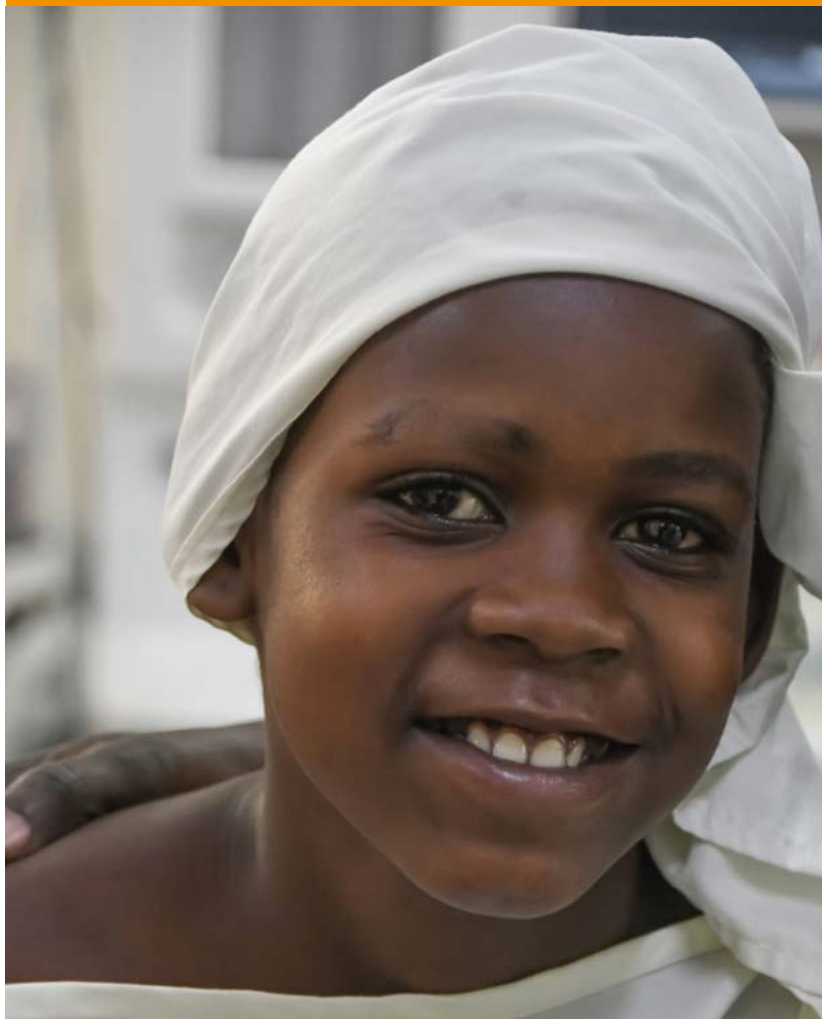
Erwartungsvoll, aber auch ängstlich - das 12-jährige Mädchen im OP vor Ihrer Harnröhrenplastik. Es werden zunehmend Mädchen mit Harninkontinenz aufgrund von angeborenen Fehlbildungen geschickt und erfolgreich operiert.