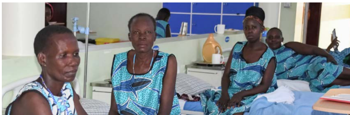
Jeden Tag operierte das TERREWODE Team drei bis vier Patientinnen, der Krankensaal war voll besetzt.

dungen im Urogenitaltrakt aus ganz Uganda geschickt. Beim letzten Aufenthalt hatten wir ein 12-jähriges Mädchen operiert, das keine Harnröhre ausgebildet hatte und von Geburt an den Urin nicht halten konnte. Es war eine Freude zu hören, dass sie zwischenzeitlich kontinent ist und keine Harnwegsinfekte mehr hatte. Sie wird einmal ein völlig normales Leben führen. Auch dieses Mal brachte eine ehemalige Patientin ein 15-jähriges Mädchen. Die Familie hatte sie verstoßen, da sie von Geburt an permanent einnässete. Es liegt eine Fehlmündung des Harnleiters in die Vagina vor, nach abschließender Diagnostik wird sie bei Dr. Fekade's nächstem Aufenthalt operiert werden – strahlend und voller Hoffnung ging sie nach Hause.